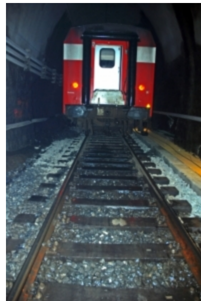
An der transeuropäischen Route vorbeigebaut: Der Koralmtunnel

"Viel schlauer" sei laut Knoflacher die Schweiz bei der Planung des St. Gotthard-Tunnels vorgegangen. Eine Finanzierung durch den LKW-Verkehr und Unterstützungszusagen der EU würden dem Projekt einen stabilen Finanzrahmen geben, zudem sei es von einem positiven Volksentscheid getragen. Die neue St. Gotthard-Route verlege bereits vor Baubeginn des Brenner-Basistunnels, der das österreichische Pendant der Verbindung zwischen Deutschland und Italien darstellt, die Hauptverkehrsrouten über die Schweiz - und sichere den Eidgenossen damit Einnahmen. In Österreich würden bei einer Einbindung der Bevölkerung "zahlreiche Projekte anders verlaufen". Eine von Knoflachers Institut durchgeführte Umfrage in Kärnten habe gezeigt, dass das Koralmpjekt "keine Chancen für eine Mehrheit besitzt". (Ende)