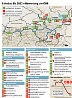
Bahnbau bis 2012